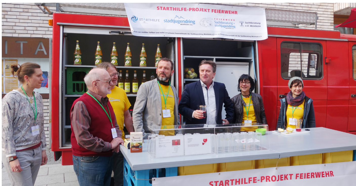
Minister Lucha (in blauem Jacket) an der alkoholfreien Cocktailbar „Feierwehr“