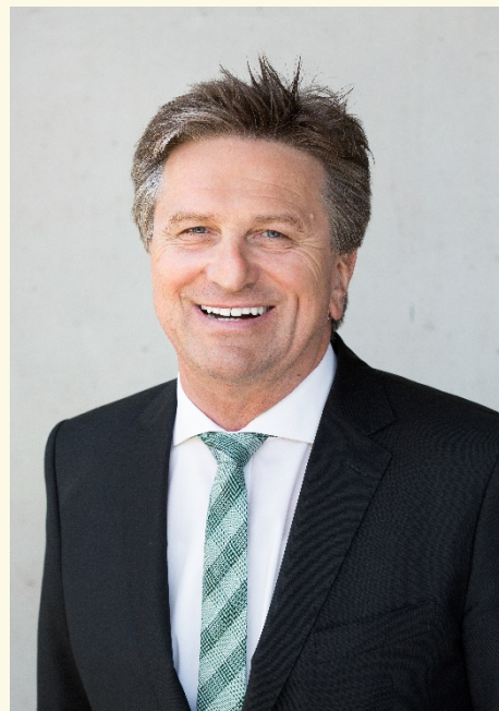
Manne Lucha MdL

Ministar za socijalna pitanja i integraciju Baden-Württemberg